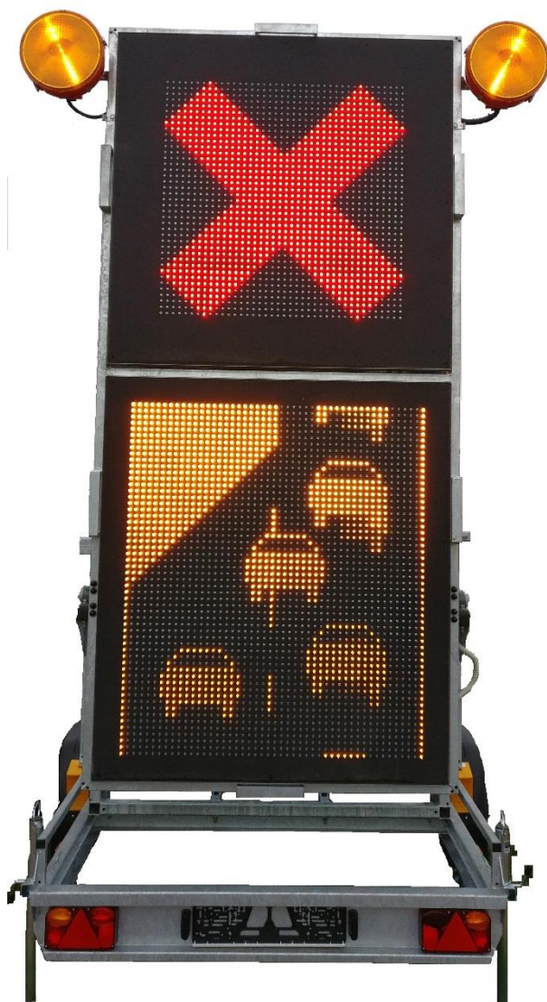
4. MVMS wyświetlający GIF.