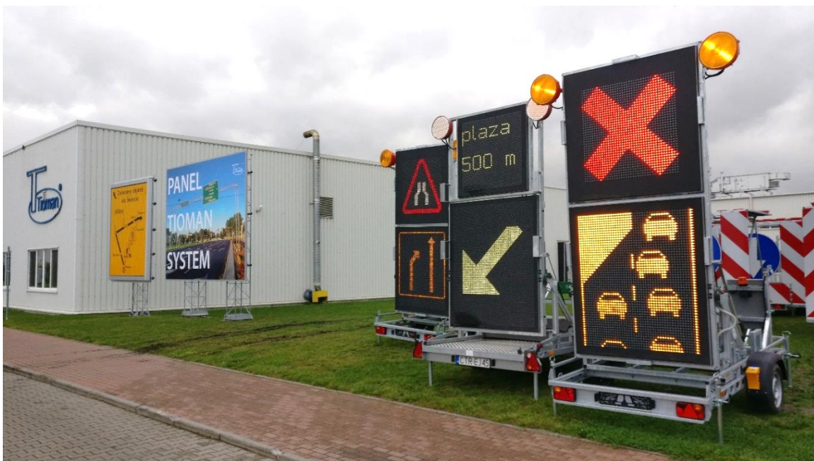
1. Siedziba Tioman – przyczepy MVMS.

MVMS (Mobile Variable Message Signs), czyli mobilne znaki zmiennej treści, dają możliwość wyświetlania dowolnych znaków drogowych wraz z informacją tekstową. Poprawiają bezpieczeństwo na drodze, informując/ostrzegając kierowców przed utrudnieniami w ruchu lub sygnalizując zmianę trasy. Jedną z największych zalet MVMS jest aplikacja (na smartphone/tablet), która pozwala na zdalne zarządzanie produktem. Aplikacja ta umożliwia wgląd w rzeczywiste ustawienie znaków oraz sprawdzenie stanu urządzenia.