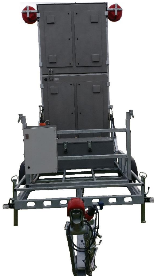
3. Przyczepa MVMS.